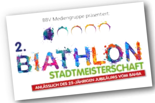
Die Sieger der ersten BBV-Biathlon-Stadtmeisterschaft.