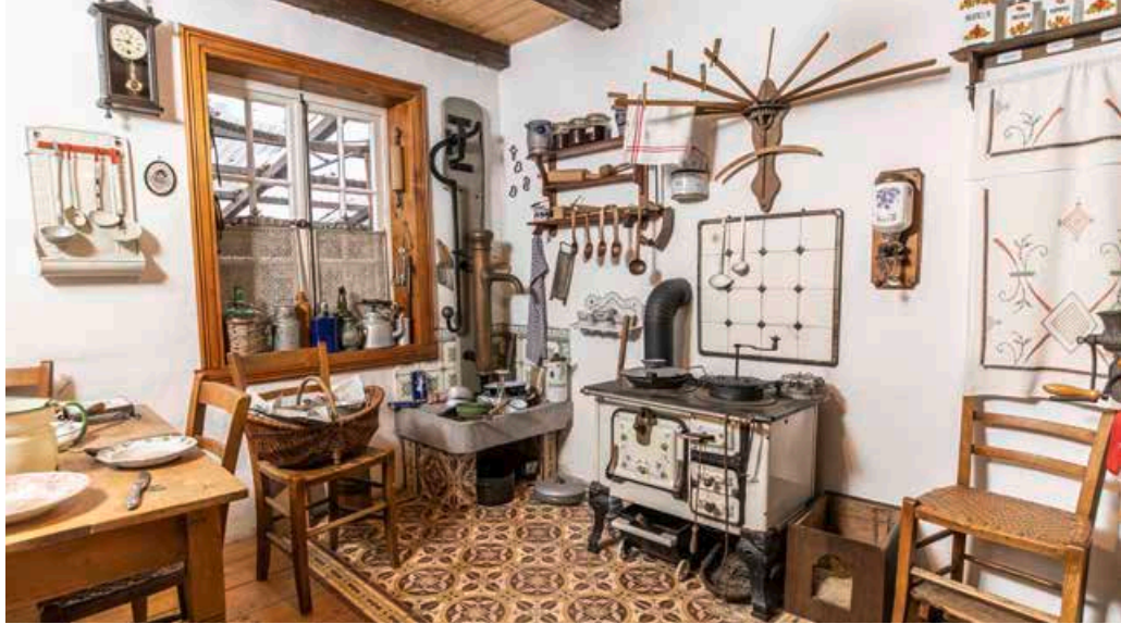
Nur eines von vielen Schmuckstücken im Bocholter Handwerksmuseum in der Köcherstraße 4. Hier wird Geschichte wieder zum Leben erweckt.

Wer sich im Museum umsehen will, einen Termin für eine Gruppenführung braucht oder den Verein aktiv oder passiv unterstützen möchte, findet den Fördermitglieds-Antrag und alles Wichtige unter bocholter-handwerksmuseum.de oder telefonisch unter 0176/964 44 317 .